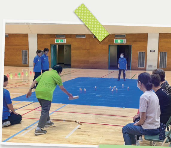
障害者スポーツ(モルック)

「NPO法人大田区障がい者スポーツ指導研究会」の活動を实地見学ならびに参加。「障害者スポーツ」の全般を理解する為、関係資料を収集・整理。