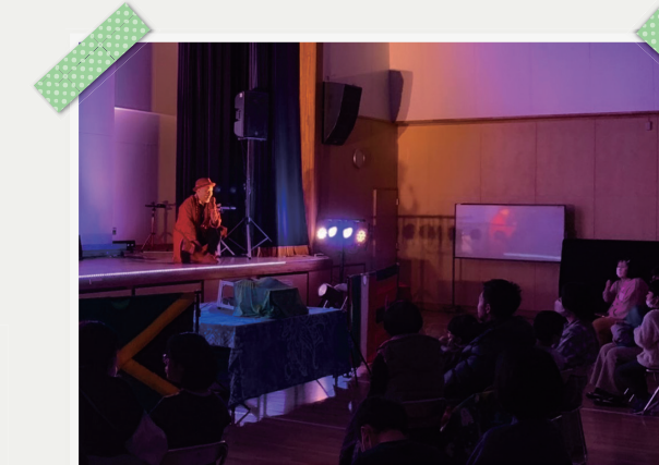
イルミ☆ミュージック心魂プロジェクトの様子

イルミ☆ミュージック：障害児向けデリバリーパフォーマンス「心魂プロジェクト」見学(令和7年1月) 大身連：障害者自らによる中学生向け、講和ならびに研修実施(令和7年3月)